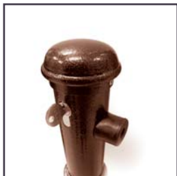
Zámek v horní části sloupku. Po postavení sklopného sloupku dojde k automatickému uzamknutí ve svislé poloze