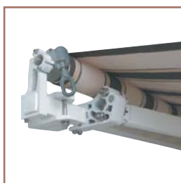
Uchycení ramene k nosnému profilu