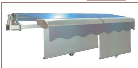
Riviera s navijecím volánem, pružinový systém, max. rozměr šíře 2935 mm x výška 800 mm